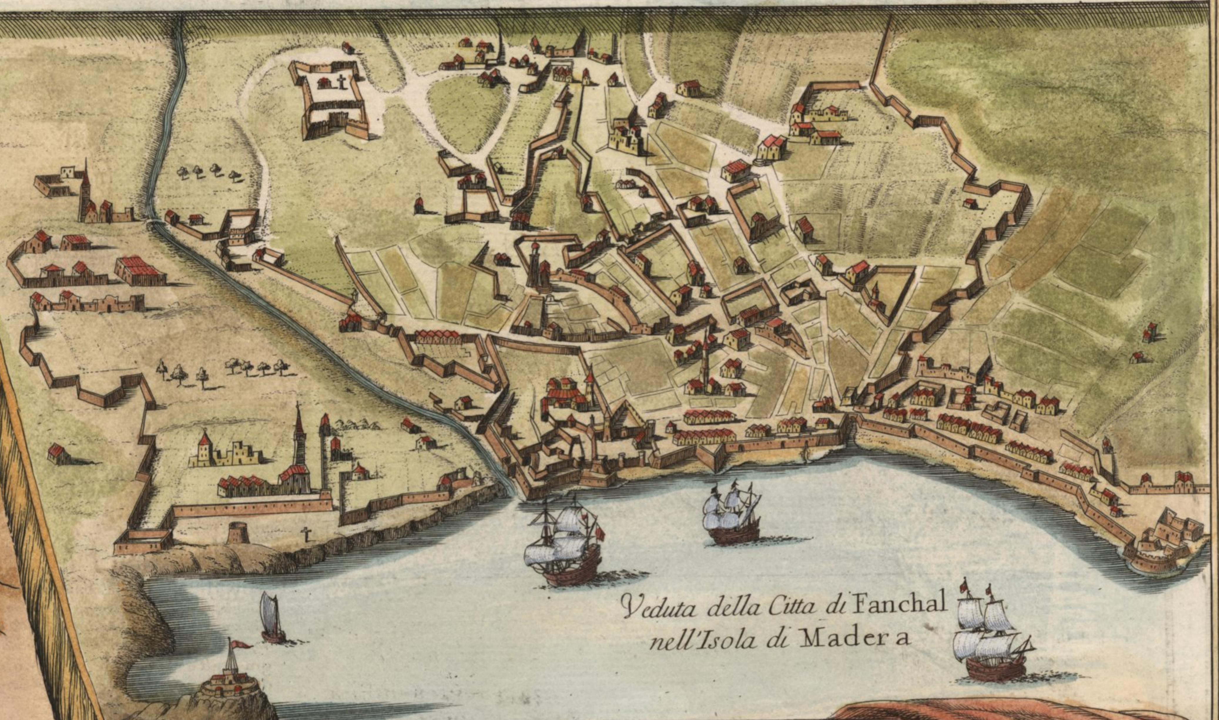
Veduta della Città di Fanchal nell'Isola di Madera

Canaria sopra del Ferro e del Gran del Ferro