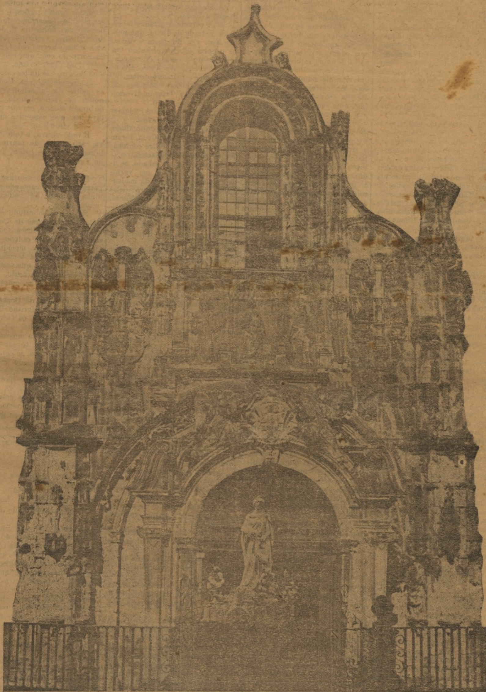
A Im gen: da Rainha Santa saindo da Igreja de Santa Cruz

Mal a rainha saía, cautelosamente, dos paços reais, a ocultas do seu senhor e amo; mal a rainha saía de mãos dadas com a madrugada, perfumando os campos do saudoso rio; mal a rainha saía translucida e calma, como as figuras seraficas, as figuras que povoam os quadros dos maiores pintores religiosos, figuras de anjos, brancas, puras, transparentes quasi, quasi imponderáveis,