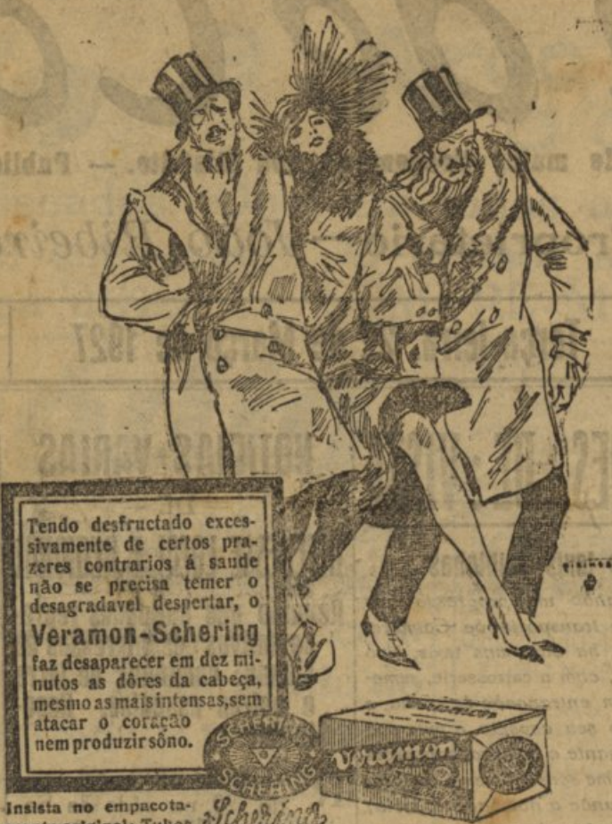
Veramon-Schering faz desaparecer em dez minutos as dores da cabeça, mesmo as mais intensas, sem atacar o coração nem produzir sono.

Tendo destruído excessivamente de certos prazeres contrários á saúde não se precisa temer o desagradavel despertar, o Veramon-Schering faz desaparecer em dez minutos as dores da cabeça, mesmo as mais intensas, sem atacar o coração nem produzir sono.