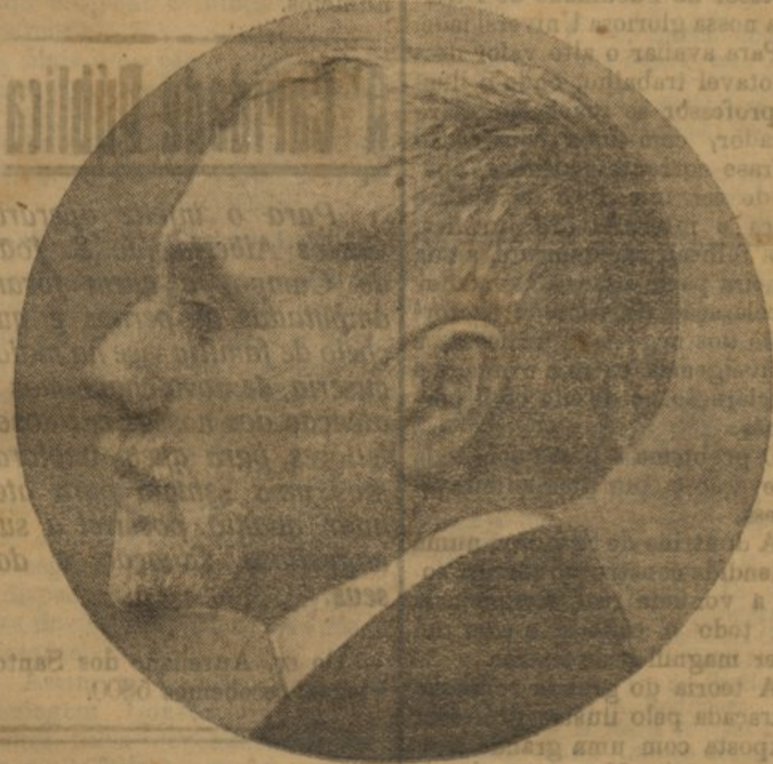
MANUEL TEIXEIRA GOMES

Perturbações internas e externas, a grande guerra, tudo tornou dificuldades, que muita gente, por odio ou por ignorancia apresenta como arma de guerra contra o regimen. Entretanto, confiado estamos que a hora grave que se atravessa, que não é só nossa mas de todas as nações, ha-de passar, e