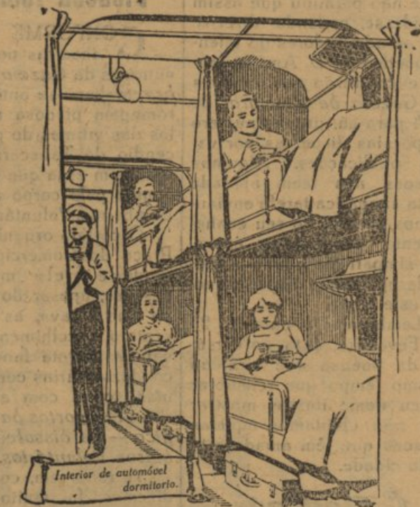
Road Sleeping Car.

SONO tranquilo — uma viagem rápida como um vôo de ave, atravessando regiões adormecidas a setenta quilómetros por hora — tal é uma viagem em carruagem-leito-automóvel, a primeira do seu género na Europa, ligação nocturna com regularidade e uniformidade entre Londres e Liverpool.