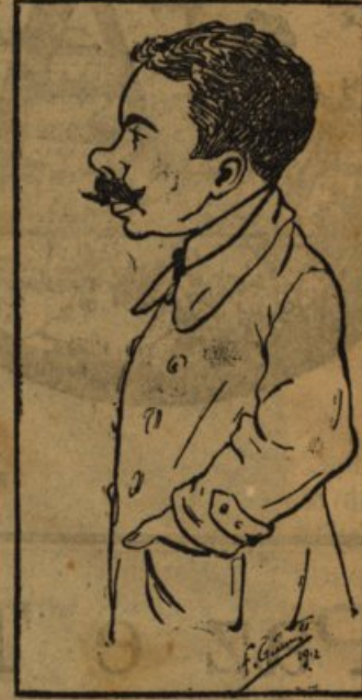
Ó sorte formosa e bela. Melhor que a sorte em amôres! A vida ó barquinho á vela. P'ra quem tem 20 valores.