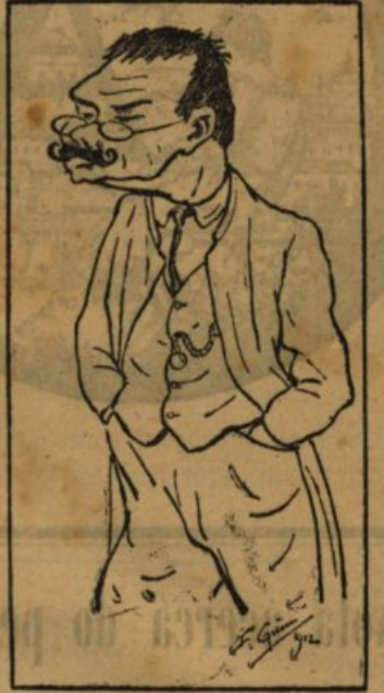
O' minha caninha bierde. O' bierde cana barreira. Dansem todos muito ciertos. E biba o doitor Moreira!