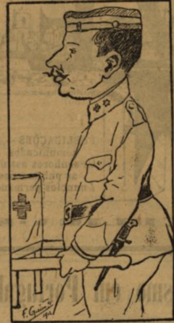
O meu amor é soldado. Foi a guerra de Souzela. Trouxe de lá cada orgão. Que fez córa as vitelas!