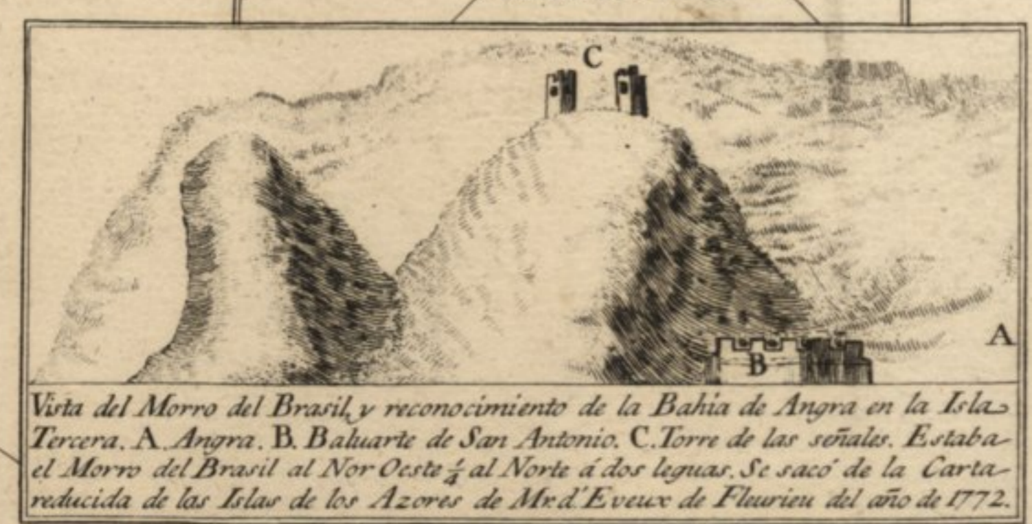
Vista del Morro del Brasil y reconocimiento de la Bahía de Angra en la Isla Terceira. A. Angra. B. Baluarte de San Antonio. C. Torre de las señales. Estaba el Morro del Brasil al Nor Oeste y al Norte á dos leguas. Se sacó de la Carta reducida de las Islas de los Azores de Mr. d'Evieux de Fleurieu del año de 1772.