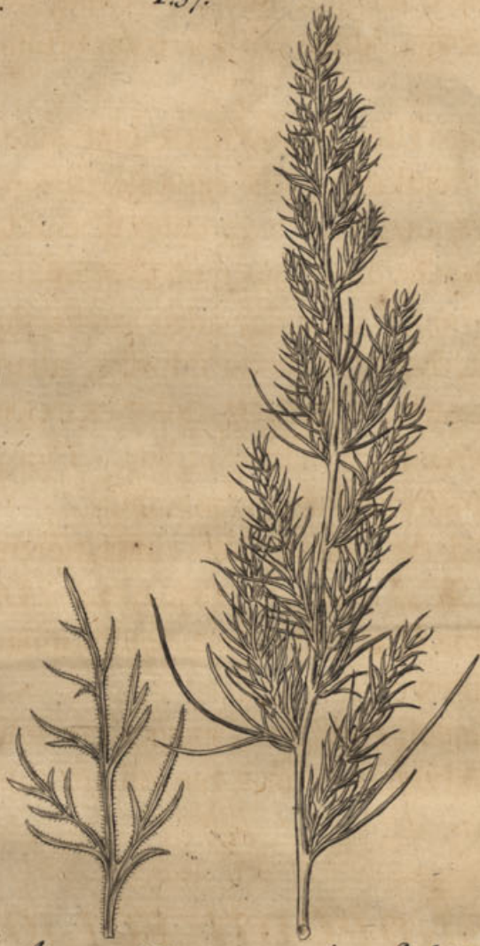
Artemisia procerior. foliis & capitulis tenuibus.