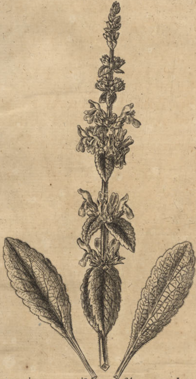
Betonica maritima, flore ex luteo palescente Tourn.