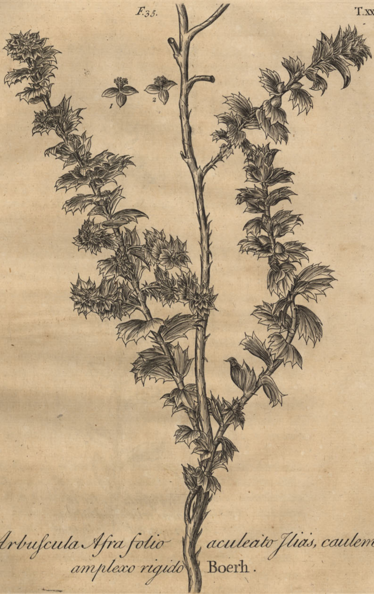
Arbuscula Afra folio aculeato glabris, caulem amplexo rigido Boerh.