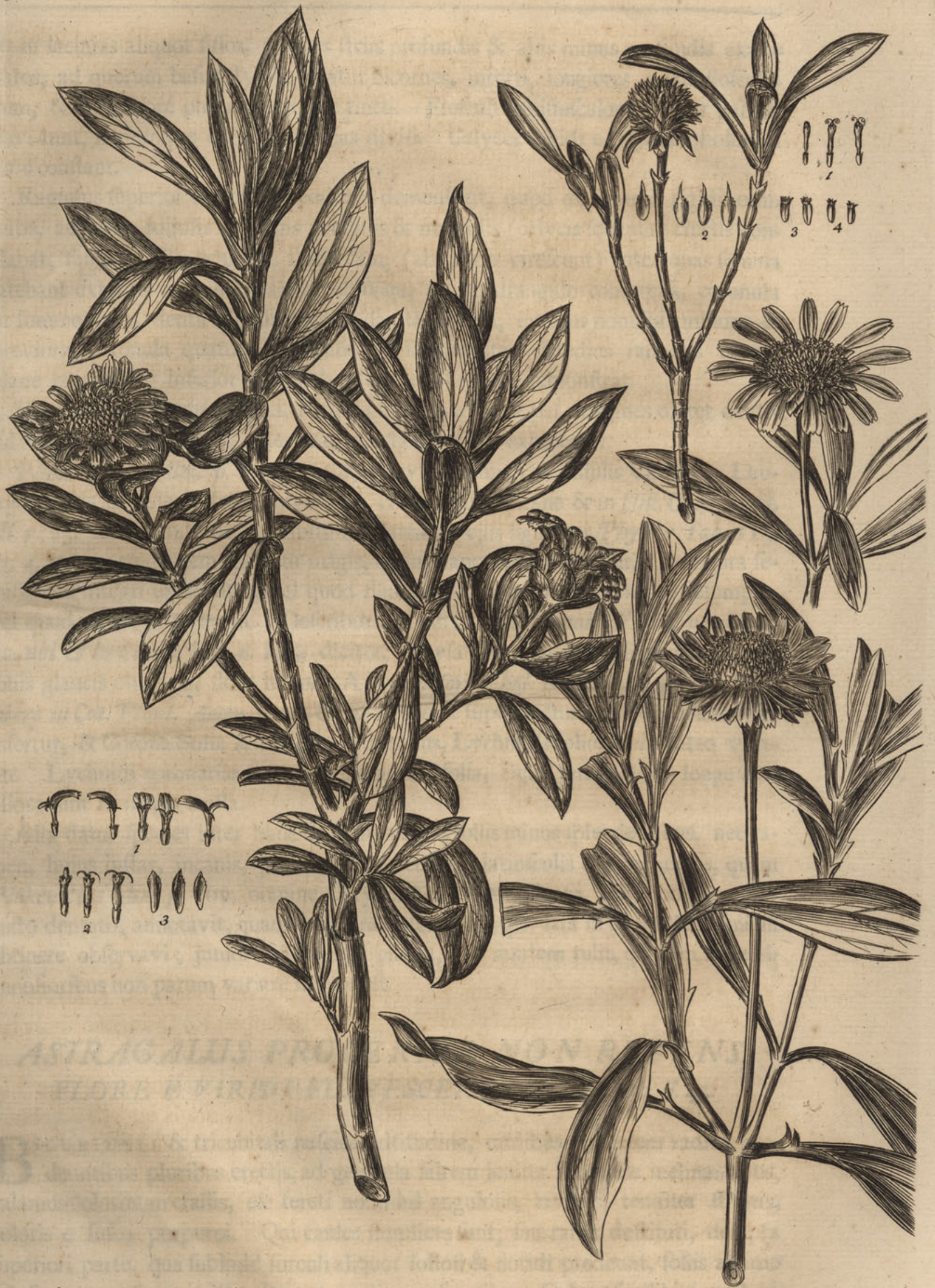
Asteriscus frutescens, Leucoji } Asteriscus frutescens, Leucoji foliis viridibus & splendidibus } foliis sericeis & incanis