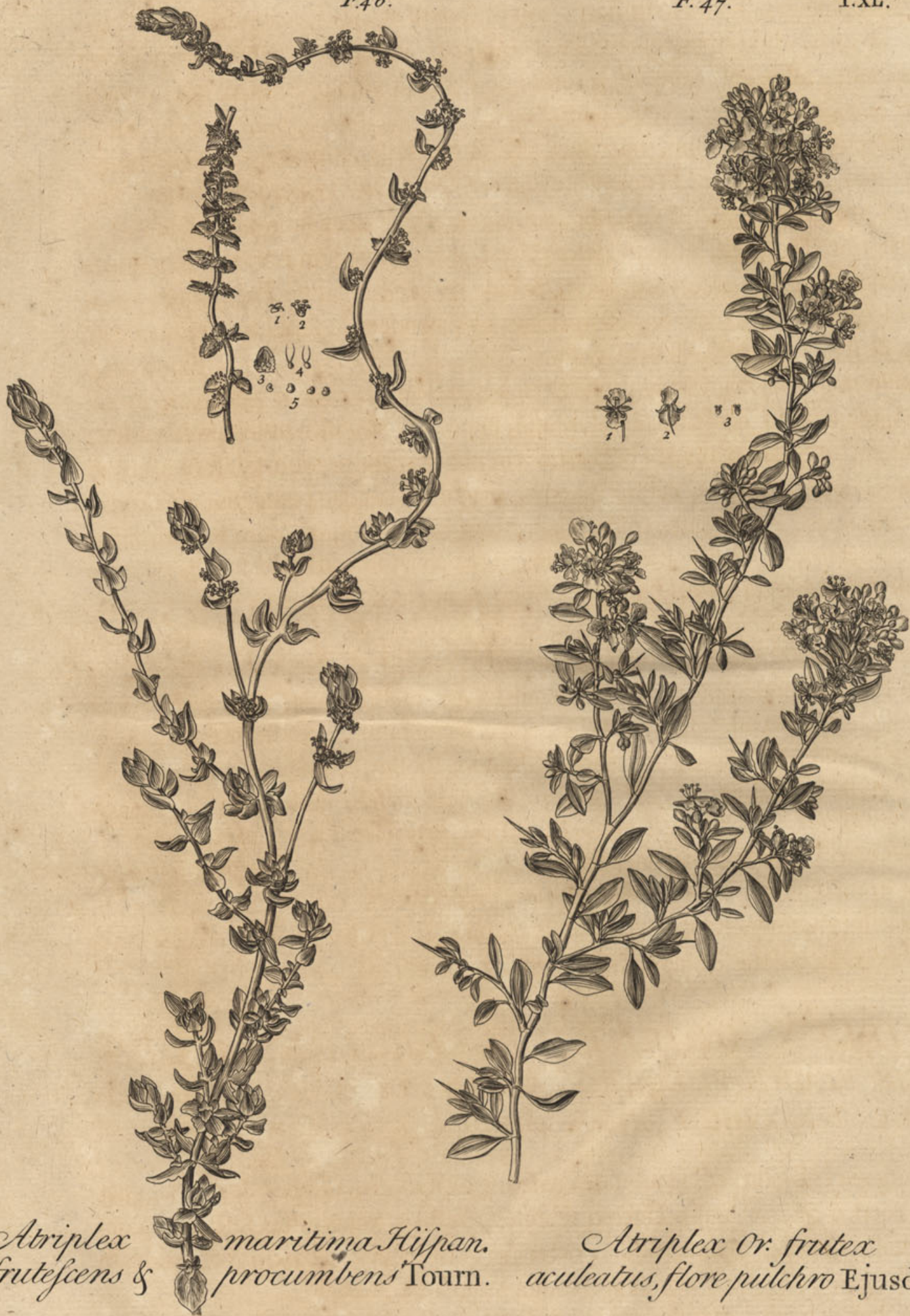
Atriplex frutescens & maritima Hispan. procumbens Tourn.