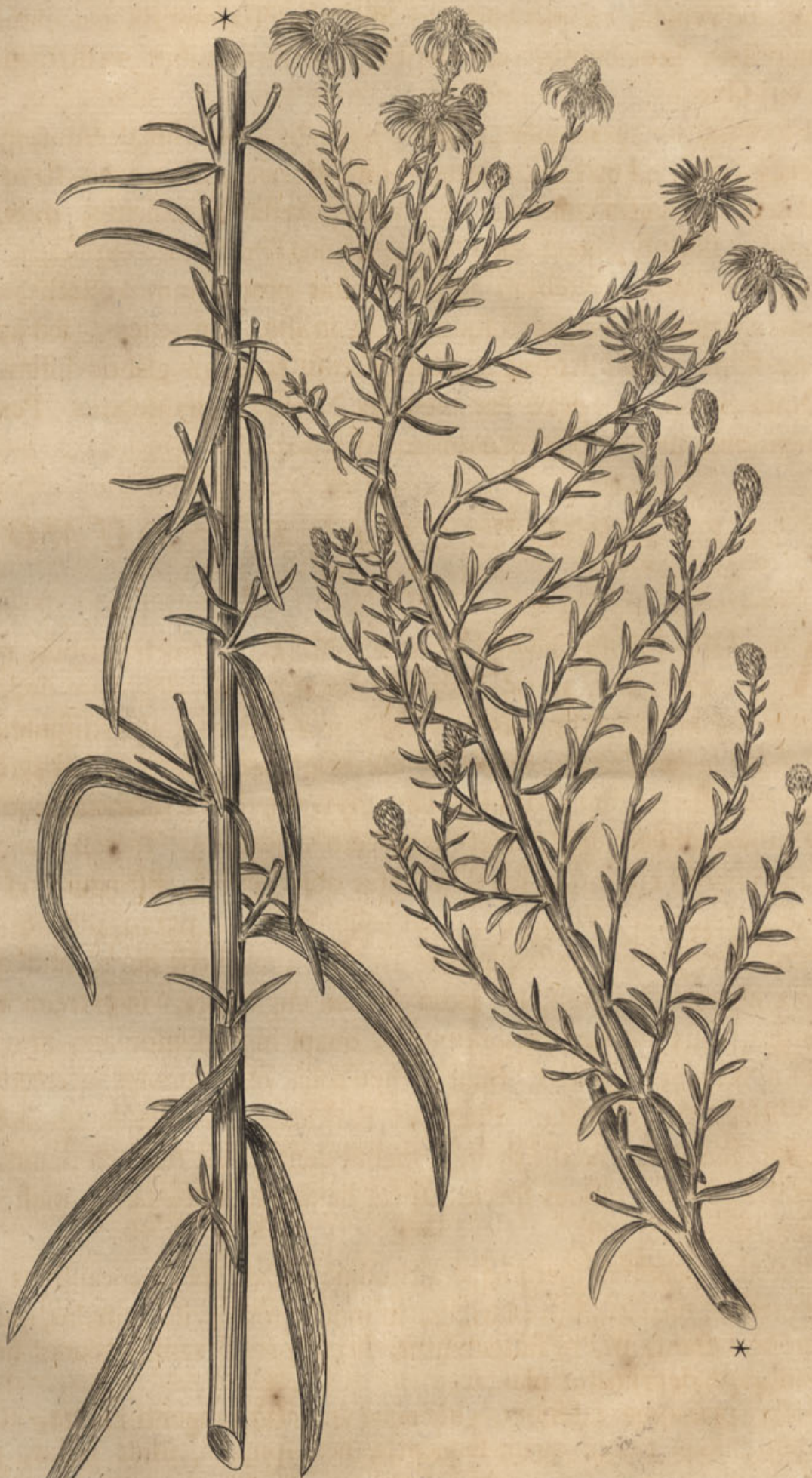
Aster ericoides, Meliloti agrariae umbone.