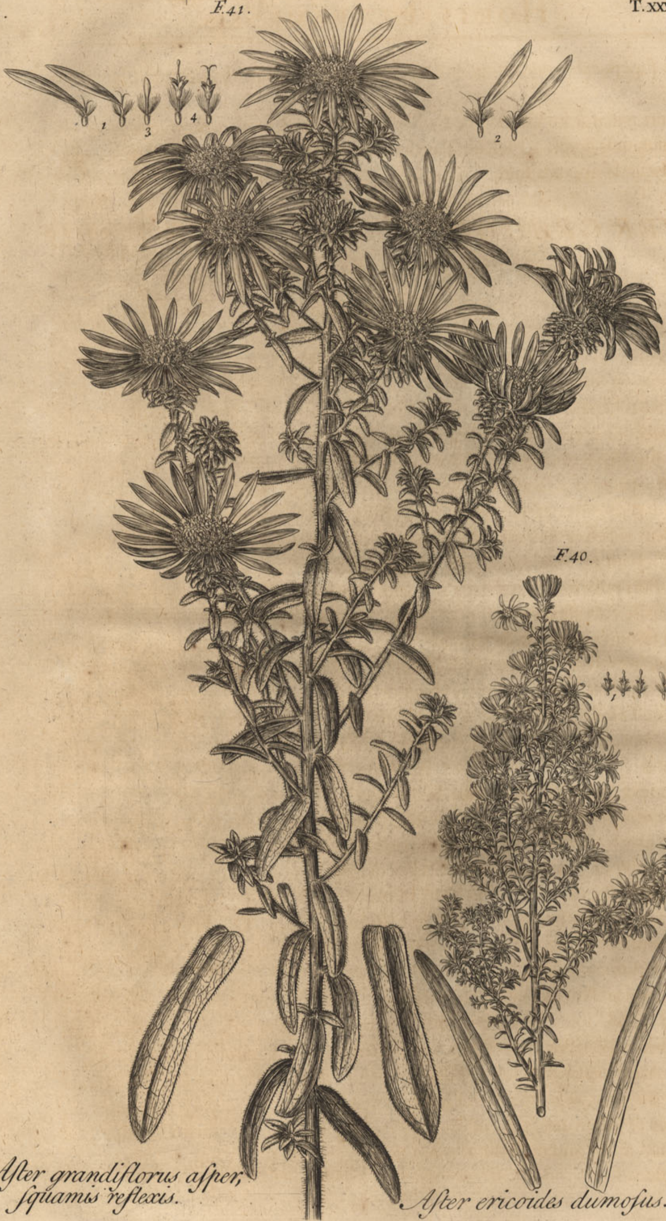
Aster grandiflorus asper, squamis reflexis.