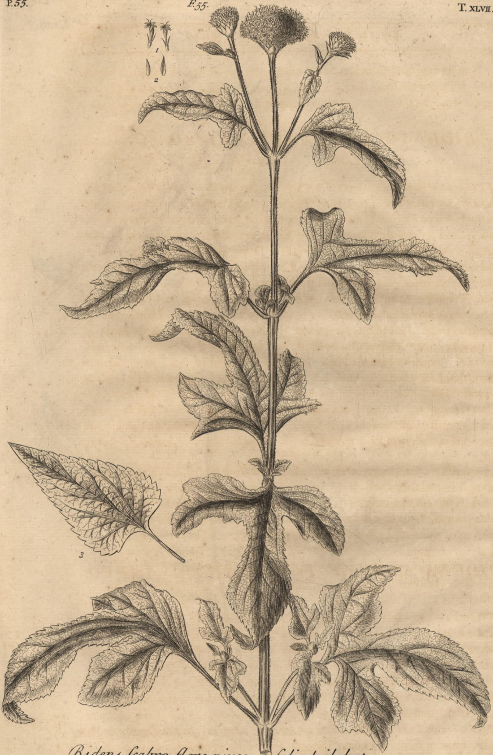
Bidens scabra flore niveo, folio trilobato.