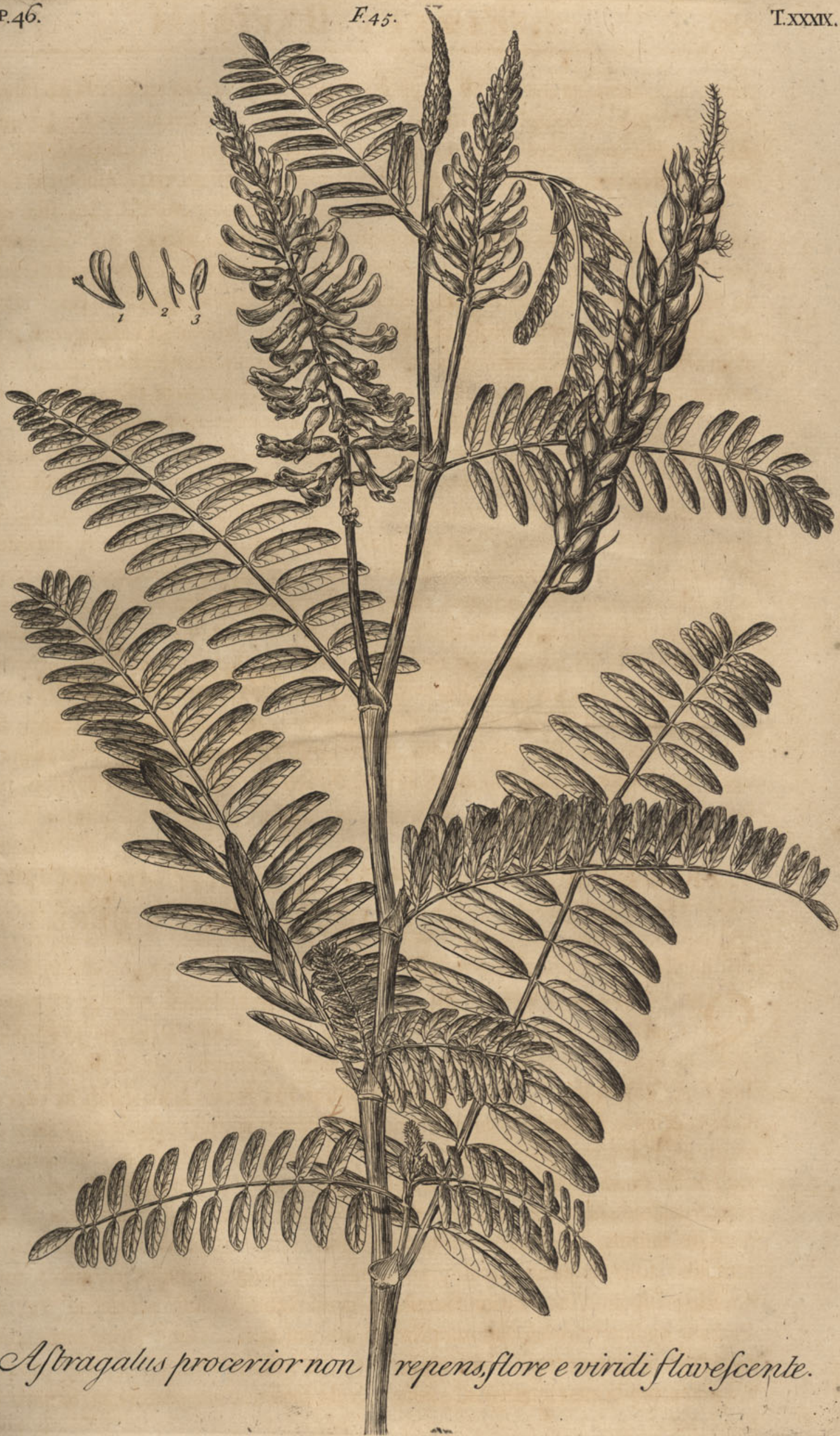
Astragalus procerior non repens, flore e viridi flavescente.