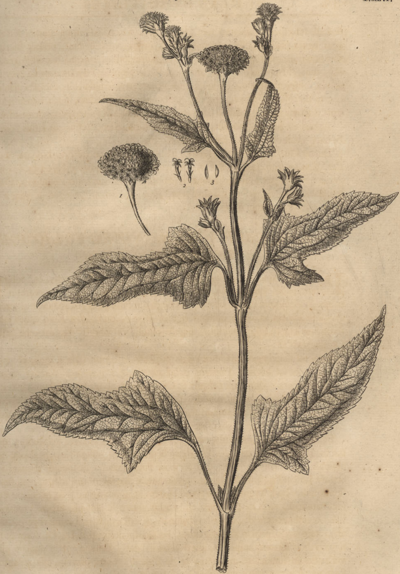
Bidens scabra flore niveo, folio panduræformi.