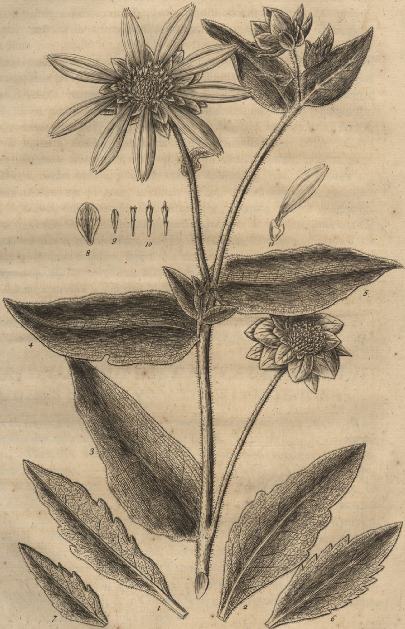
Asteriscus Coronae Solis flore & facie.