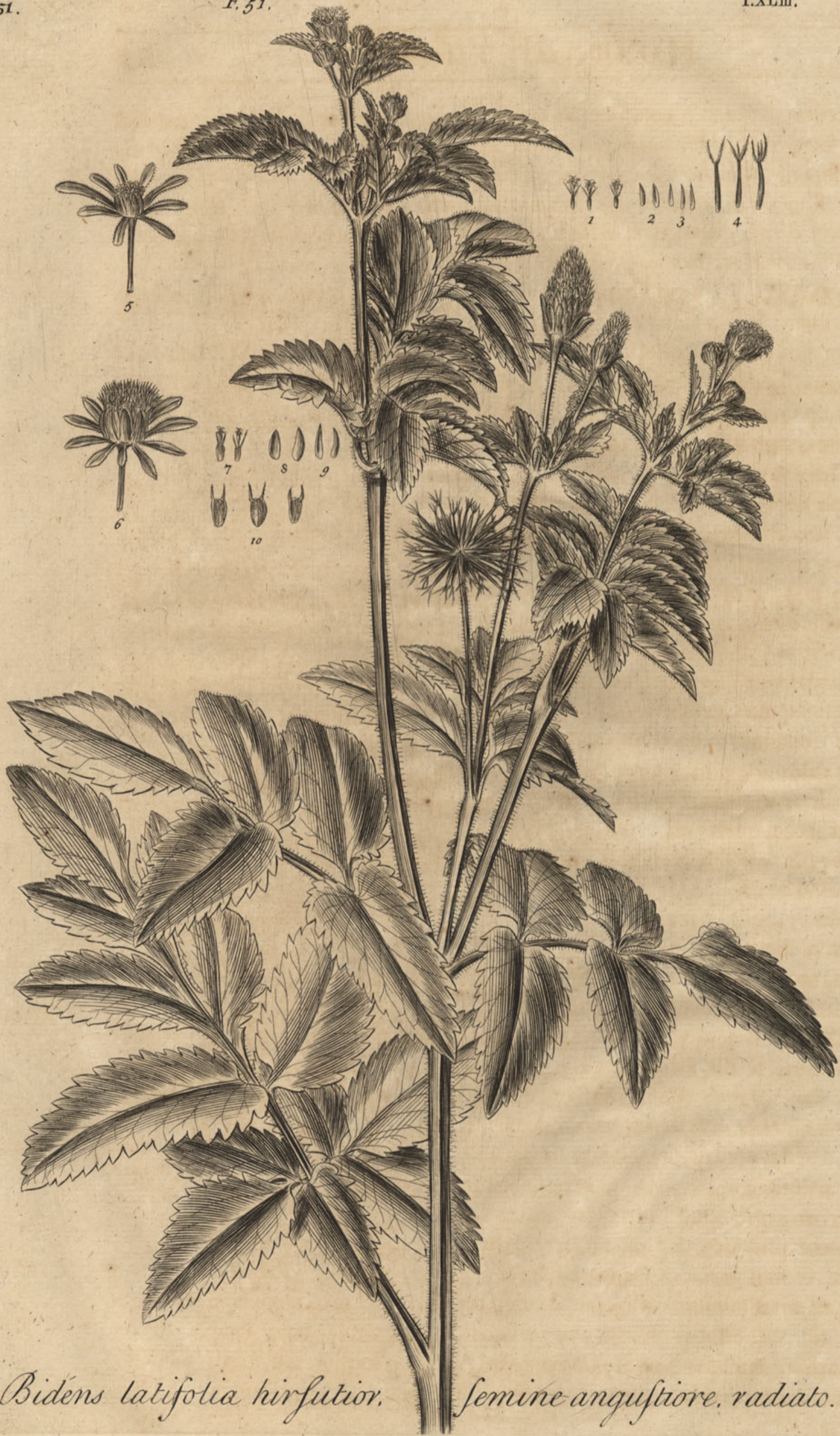
Bidens latifolia hirsutior. semine angustiore, radiato.