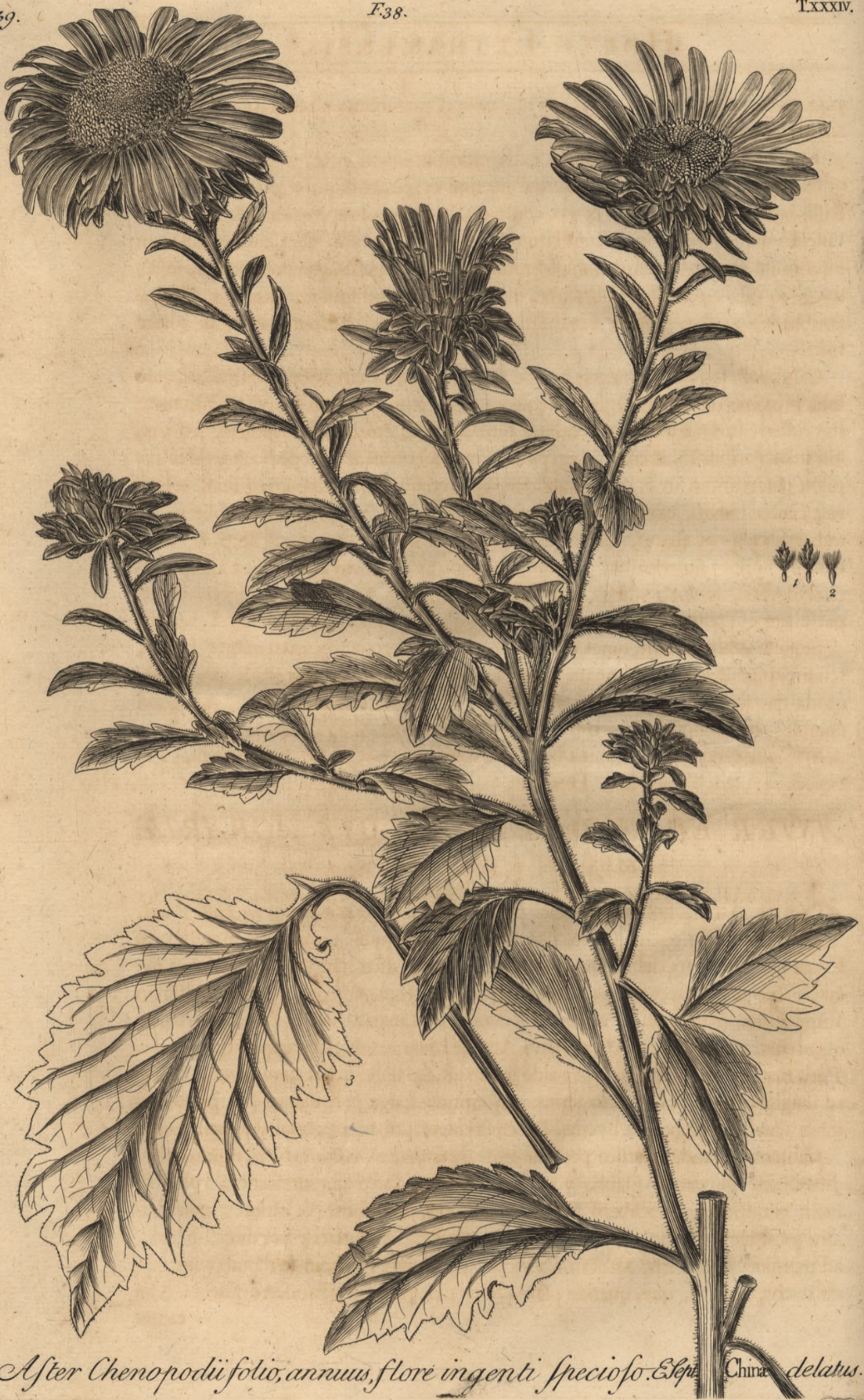
Aster Chenopodii folio, annuus, flore ingenti specioso. Elexp. China delatus.