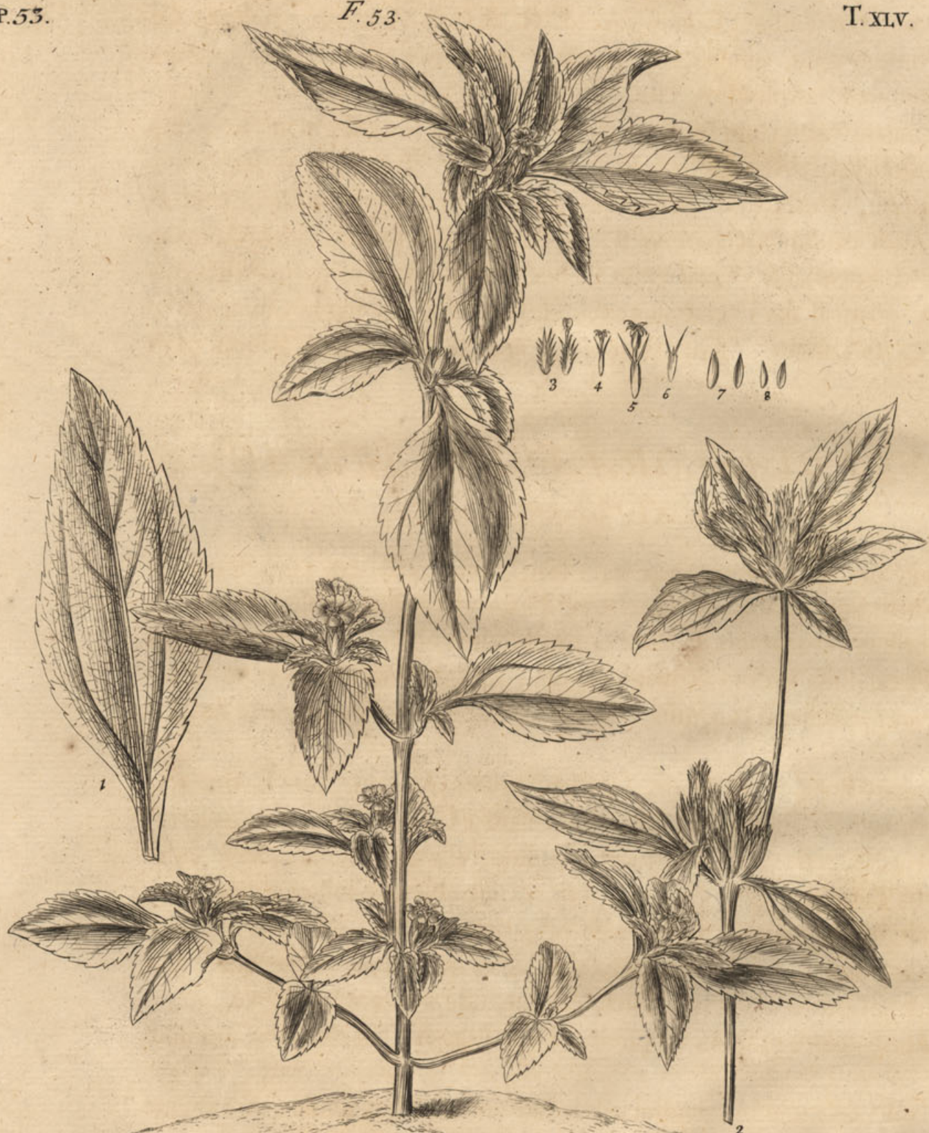
Bidens nodiflora, folio Tetrahit.