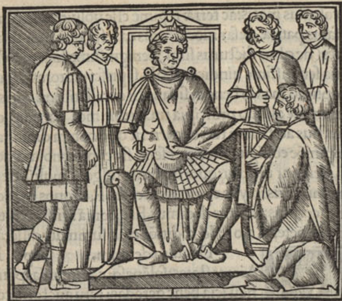
VALERII Maximi Factorę ac dictorum memo- rabiliū. Liber ad Tiberium Cæsarem. Prologus.

R B I S Romæ exterarumq; gentium facta simul ac dicta memoratu digna: q̄ apud alios latius OLIV diffusa sunt. In ac p̄fatiōe: Valerius seruat qd̄ p̄priū ē exordii: ut attentionē capet & docilitatē: VERI⁹ Proponit enim qbus de rebus dicturus sit: & se rem utilem scripturę polliceat: idq; q̄ breuissime facturę. Beniuolentiā quoq; cōparat a persona sui: cū officiū suū sine arrogantiā laudet: extenuat quoq; meritū suū cū dicat se nō tantū īgenio & industria ualere: ut oīa cōplecti possit: neq; cōfi dat: ea etiā de qbus tractaturus sit: se uel ornatius: uel copiosius q̄ ceteros esse scripturę. In reliq̄