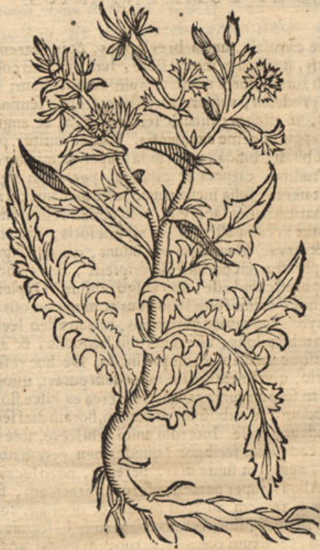
Picris sylv: cichoreum.

Fortassis hæc differentia inter cichorium & picrim Theophrasti, quod cichorium vocat sylvestre seridos genus, sed jam cultu domitum, quale est quod sativum cichorium vocant, & serius floret; contra picrim vocant, quod culturam nullam passum est, qualis planta est quam picridos nomine exhibeo, & maturius floret, ac multo amarior est. Sed picris Theophrasti planta ab hac diversa videtur; siquidem toto anno, id est, ut Theophrastus, hyeme, vere, æstateque non floret, sed tantum æstivis mensibus. Accedit quod cichorium & picris pro diversa planta apud Geoponicôn autorem habeatur. Vide