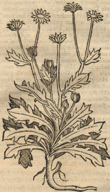
Chondrilla Vernicaria Lobelii.

plura tubera appensa sunt, perlucida, subflava, solida; & succi plena; quæ carnem raphani fermè præferunt colore & pelluciditate. Nascitur secus lacustres tractus montis Ceti Narbonæ. Hæc cichorium non est Theophrasti. quia huic non est caulis magnus, multis ramis brachiatus, lentus, dividi contumax; ut de cichorio scribit Theophrastus. Nec pro chondrilla altera haberi potest Monspeliensum dens leonis; asphodeli, vel leucanthæ bulbillis oblongis. Quia huic folium plane dissimile teneri, ac primum prodeunti lactucæ; nec tenuis, sed crassa radix. Nec chondrilla Rawolfphii pro legitima ac vera Dioscoridis haberi potest; quia huic (ut scribunt ex ipso Rhawolphio, Clusius & Lugdunensis, Etenim Rhawolf. scripta non legi, nec vidi) folium graminis longum, tenue, in terram flexum; tum quod radicem habeat crassam, nigram, fuscam. Ad chondrillarum classem quidam referunt plantã, cuius effigiem addendam curavi. Folia hæc oblonga, angusta, & aliquantum aspera fert, adnatis veluti exiguis alis ramosa, cornu cervi dictæ herbæ satis similia, & eodem fere modo per humum decumbentia; tamen aliquanto majora, & longiora; è quibus mediis cauliculi assurgunt tenues, ramosi,