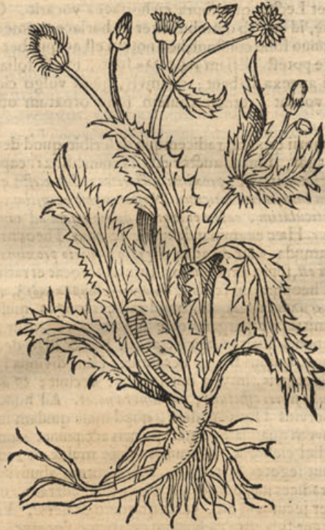
Sonchus sylv: asperior.

Supra cap. vii. diximus, ex doctissimorum virorum sententia, sonchum, & quidem asperum, ejus iconem addidimus, esse hypochærin. Huic opinioni planè contrarius est locus hic Theophrasti. Etenim inter cichorea hypochærin inquit esse aspectu mitiorem, levio-rem, dulciorem; cum sonchus sit asperior, nec non horridior, nec reliquis cichoraceis dulcior. Caulem enim fert subrubentem, spinis horridum, foliisque con-