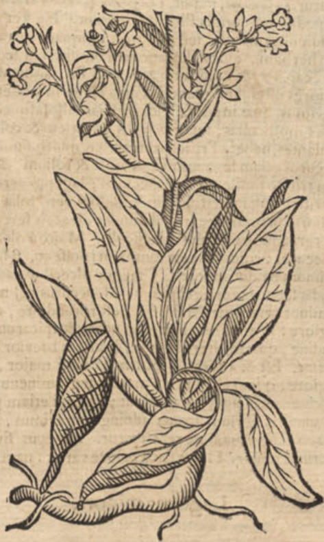
Cynoglossum cum flore.