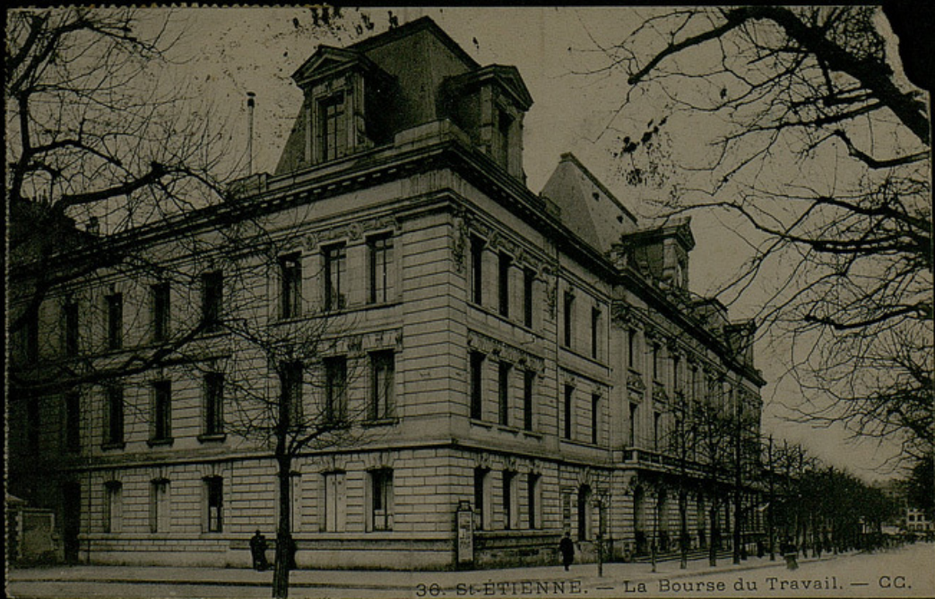
36. ST-ÉTIENNE. — La Bourse du Travail. — CC.