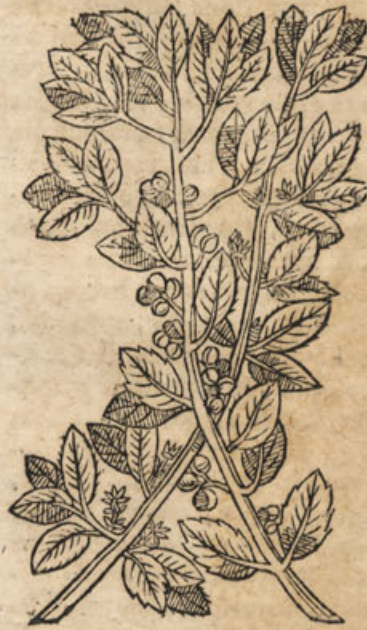
Alaternus 2. Clus.