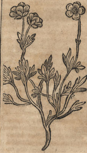
Ranunculus montanus purpureus calyce villos, Fælic. Plateri.

P lantula: huius facies diligenter que consideratio facillè diligentibus differentiam sui à reliquis Ranunculi specibus ostendet. Dodrantalis est plantula. Folia velut in digitos dissecta, partim à colliculorum exortu longis pediculis hærentia, partim ex ipsis pediculis