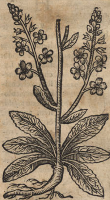
Blattaria pilosa Cretica, siue Arctus quorumdam.

E xstat hæc Blattaria flore ex viridi purpurascente à Lobelio picta in Icon. Plat. p. 566. C. B. in phyt. sub tertia, quarta in Pin. siue alba meminit Opraferemus has Blattarias ab autoribus diligentius fuisse delineatas.