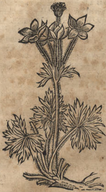
in Silesiæ montium conuallibus floret.