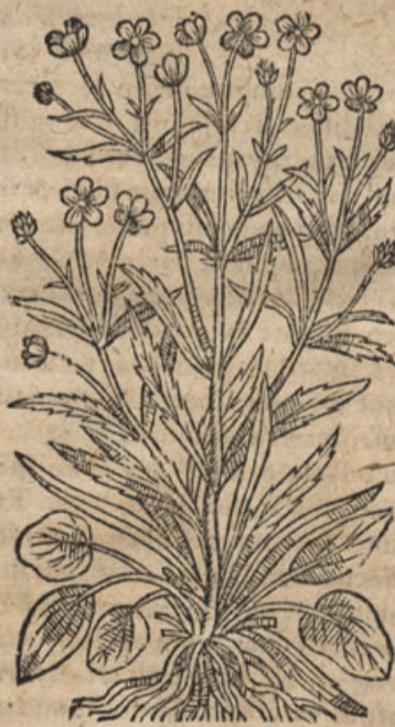
Ranunculus longifolius, alijs Flammula.

C aulis est Dodranti, glabro, fistuloso, geniculis nodoso, nunc solitario, nunc in ramos diuiso, reptante: folia priora ex longis pediculis vnicam semis lata, oblonga alia, alia subrotunda, superiora per caules ex articulis oriuntur, bina, interdum serrata quæ minus angusta, longitudine circiter palmari, sapore acri: flores Ran. vulgaris pratensis, contractiores, aureo fulgore nitent: radix ex fibris albicantibus conflata est: caules etiam serpunt, & quidem rursus, vt in Ranunculis quibusdam, radican- tur.