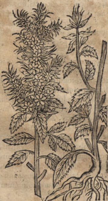
Blattaria flore viridi purpurascente.

P ingitur hæc à Lobelio in Iconib. Plantar. pag. 565. Blattariæ flore viridi titulo. C. Bauh. Tom. III.