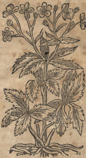
Ranunculus flore albo Alpinus maior.

Germ. Gefülter weisser hanensfuß / gefült weißer hlers / buttons or double white Crowfoote . Nomina linguarum