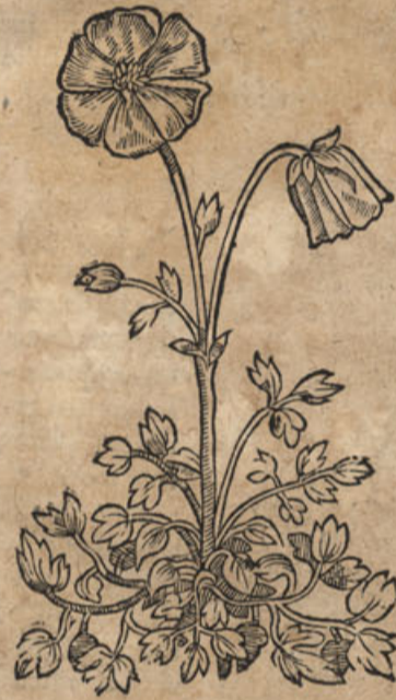
Ranunculus Creticus albo flore, maiore quàm Papatæris rhæadis.

F oliis est Ranunculi pratensis vel hortensis repentis, diuisis specie trifoliâ, rariùs quinquefoliâ, per margines crenatis, per terram sparsis: caule rotundo, pedali, qui duos vel tres flores sustinet magnos, ex sex, vel septem foliolis compositos, albos, Papatæris erratici florem magnitudine superantes, quibus succedit capitulum seminibus aliorum Ranunculorum more confarctum.