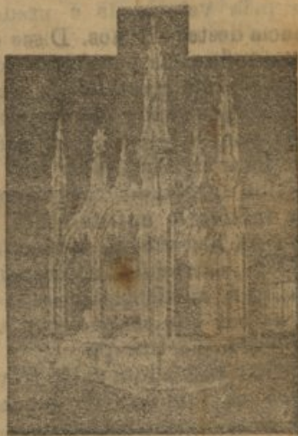
O túmulo de Alexandre Herculano no Mosteiro dos Jeronimos