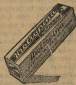
Valor de 20 contos.

Fazer desaparecer os microbios nocivos do organismo é uma tarefa mais difficil do que limpar um jardim de hervas nocivas. Para isso será indispensavel servir-se da Urotropina, considerada pelas eminencias medicas como da mais alta eficacia. Empregue V. E.: para prevenir e curar doencas infecciosas (gripe, angina, etc.) especialmente das vias urinaarias e biliares, sempre os